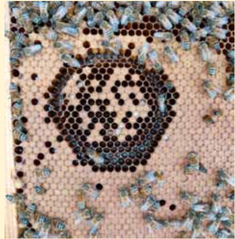
Kontrolle nach 12 bis 20 Stunden Ausräumrate nach 20 Stunden „nur“ etwa 50%

Amerikanische Forscher fanden 6 verschiedene Genorte auf 2 Chromosomen (Oxley, Spivak und Oldroyd 2002 / 2010). Sie vererben additiv, d.h. je mehr Anlagen im Volk vorhanden sind, desto ausgeprägter zeigt sich das VSH Verhalten.