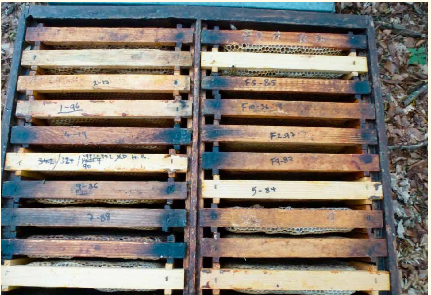
Vorbereitung der Miniwaben für die Milbeninfektion