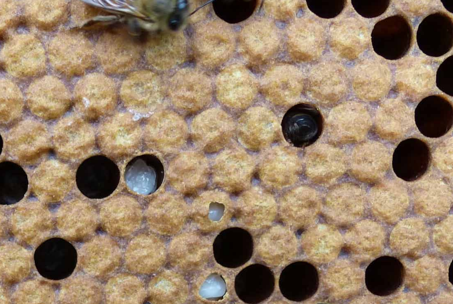
Wenige Stunden nach der Rückgabe der nun infizierten Brut beginnt bei den besten Völkchen das Ausräumen.

echte „Volksatmosphäre“ herrscht. Mit einigem Geschick reicht die Lebensdauer der Königin aber aus um nach der Auswertung eine Nachzuchtgeneration zu ziehen. Diese kann selbst bei Standbegattung im Folgejahr als Drohnenspender dienen.