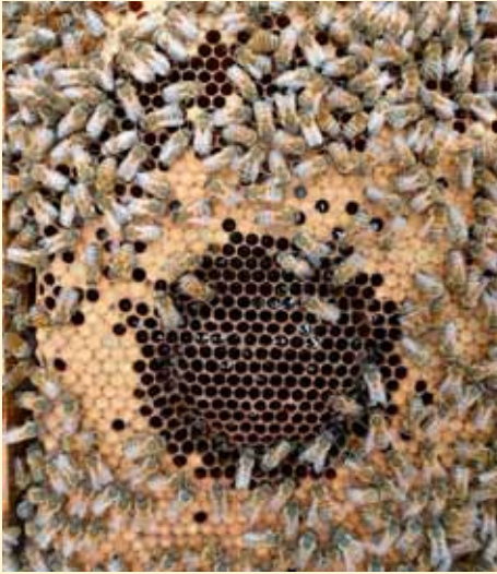
Ausräumrate 100% nach 20 Stunden