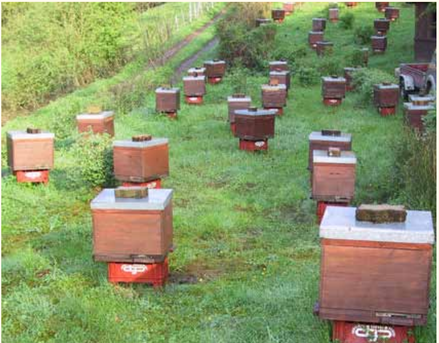
Die zentrale Zuchtstation mit den 4er Einheiten ermöglicht die Vorprüfung und den Vergleich großer Zuchtserien unter identischen Bedingungen.

Der eleganteste Weg, ein bestimmtes Merkmal in eine Zuchtpopulation einfließen zu lassen ist die Verwendung entsprechend selektierter Drohnen und kontrollierte Verpaarung, und das wiederholt über mehrere Generationen. Meistens wird in Zuchtprogrammen mit Geschwistergruppen als Drohnenspender gearbeitet. Nun ist aber klar, dass nicht jede Nachzuchtkönigin eines Volkes, welches tote Brut schnell und gründlich ausräumt, diese Erbanlagen mit-