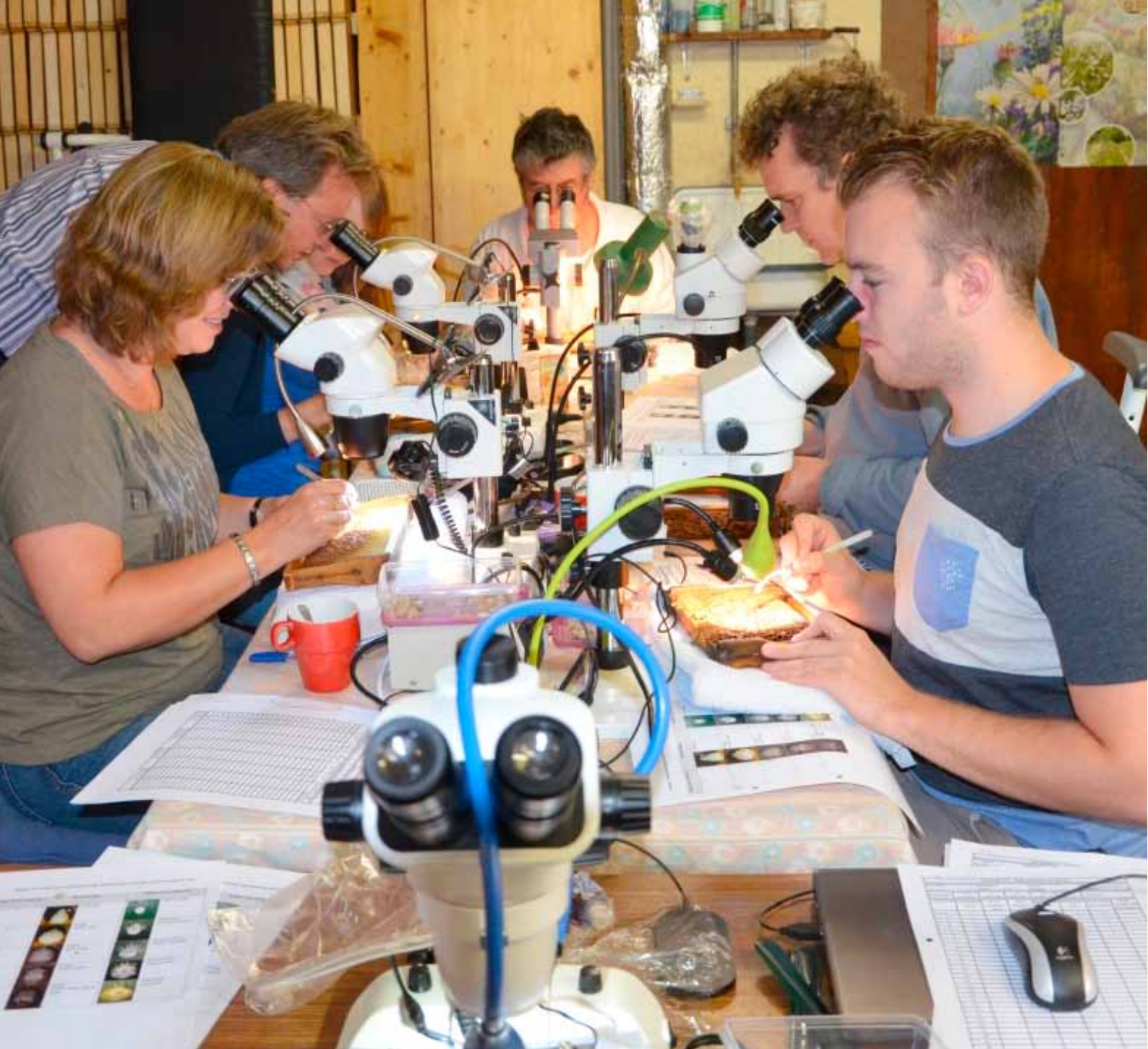
Auszählen der Brut von 24 Völkern nahm zusammen mit den Mitarbeitern der ARISTA Stiftung einen ganzen Arbeitstag in Anspruch

20 Königinnen gingen Mitte September in Eiablage. Nach weiterer Auslese im kommenden Jahr soll die Versuchsreihe u.A. mit dieser Linie als Drohnenspender fortgesetzt werden.