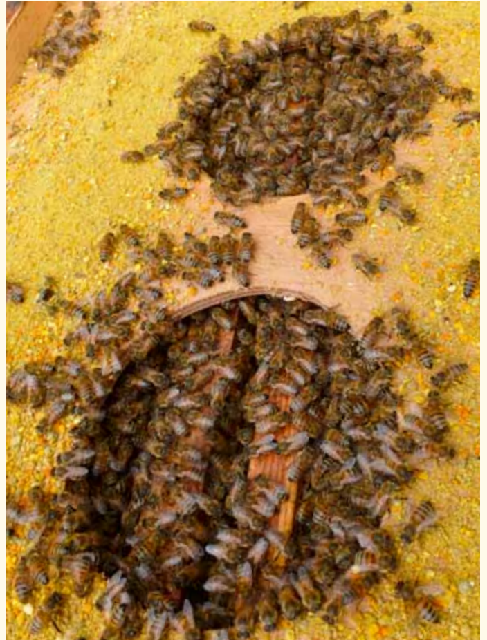
Die Jungbienen des Sammelbrutablegers verzehren den angebotenen Frühjahrspollen und werden so nach Mitte August zu einem perfekten Pflegevolk