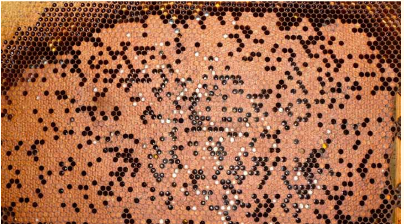
VSH in einem Ertragsvolk in perfekter Ausprägung: 100% der Milbenfamilien wurden von den Arbeiterinnen dieses Volkes erkannt und ausgeräumt.