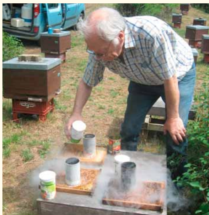
Abfrieren kleiner Brutkreise mit flüssigem Stickstoff.

Verschiedene Methoden sind bekannt: die Einfachste ist wohl der Pintest, weil er ohne größere Vorbereitung von jedermann durchgeführt werden kann: entlang einer Schablone markiert man die erste Zelle, sticht mit einer sehr dünnen Nadel genau 100 verdeckelte Zellen tot (Alter: purpurfarbene Augen der Puppen), markiert das Ende auf der Wabe und kann nach 12 bis 24 Stunden das Ergebnis ablesen. Viel eleganter ist das Erfrieren der Brut mittels flüssigem Stickstoff, welcher in eine aufgedrückte Konservendose gegossen wird. Hier werden die zu prüfenden Zellen nicht beschädigt, was der Genauigkeit des Ergebnisses wohl dienlich ist. Zur Not kann man sich auch des Gasbrenners bedienen, um eine abgegrenzte Brutfläche durch Hitze