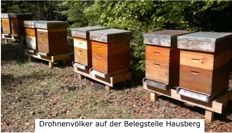
Drohnenvölker auf der Belegstelle Hausberg